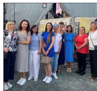
Geschniegelt und gestriegelt bei „Bühne raus“.

Doch dieser Abend war mehr als nur eine Aufführung. Dank der großzügigen Unterstützung der Stadt Hof konnten zahlreiche Eintrittskarten gespendet und gezielt an Menschen aus unterschiedlichen Kulturen, sozialen Kreisen und Lebensrealitäten weitergegeben werden. Ziel dieser Aktion: Menschen durch Kultur verbinden und Teilhabe ermöglichen, unabhängig von Herkunft oder Geldbeutel. Solche Abende stärken nicht nur den gesellschaftlichen Zusammenhalt, sondern zeigen auch, wie wichtig kulturelle Teilhabe für Austausch und Lebensfreude ist. Die Initiative war ein voller Erfolg!