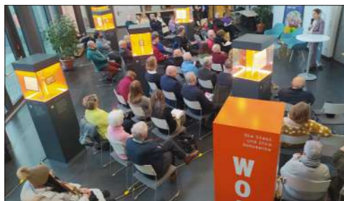
"Alles Wissen Wollen. Die Stasi und ihre Dokumente"

HOF – Eine zentrale Stütze der DDR-Diktatur war das Ministerium für Staatssicherheit: die Stasi. Sie war Geheimpolizei, Ermittlungsbehörde und Auslandsnachrichtendienst zugleich, sie bespitzelte, manipulierte und überwachte.