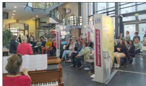
„Häusliche Gewalt LOSwerden“

HOF – Eine weitere Wanderausstellung greift das heute oft noch tabuisierte Thema „Häusliche Gewalt“ auf, Gewalt, die in Ehe, Partnerschaft oder Familie stattfindet. Etwa 80 Prozent der Opfer sind Frauen. Die Wanderausstellung „Häusliche Gewalt LOSwerden“ informiert, sensibilisiert, ermuntert dazu, genau hinzuschauen und verweist auf die vielfältigen Hilfsangebote für Betroffene in Bayern.