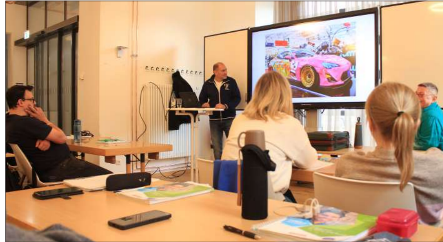
Firmenvortrag der Tuner-shop Naila GmbH