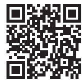
AS Bau Hof war von der Vortragsreihe begeistert, wie ihr Instagram-Post verrät