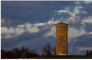
Jürgen Greim Wartturm im Abendlicht