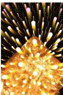
Markus Klier Fire and Ice