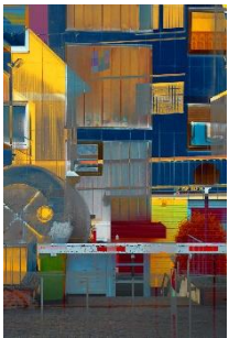
Harry Kurz Architektur-Mosaik