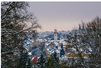
Brigitte Hager Blick vom Theresienstein