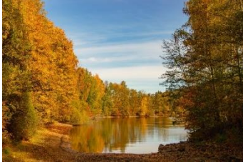
Markus Klier Herbst am Untreusee