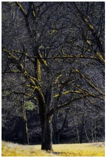
Jürgen Greim Sonnenlicht trifft Rinde