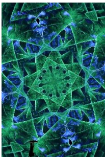
Kat Schulze illuminiertes Blatt