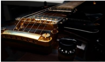
Jürgen Greim Gitarrensaiten