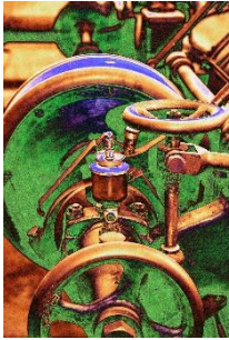
Dietmar Harms Brauereitechnik