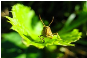
Markus Klier Grashüpfer