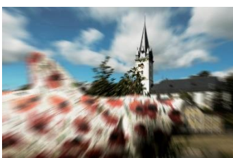
Thomas Rubner Schwarzenbacher Fischflut