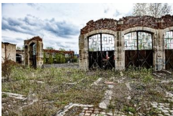
Dietmar Harms Vergangenes am Bahnhof