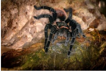
Dietmar Harms Vogelspinne mit Grille